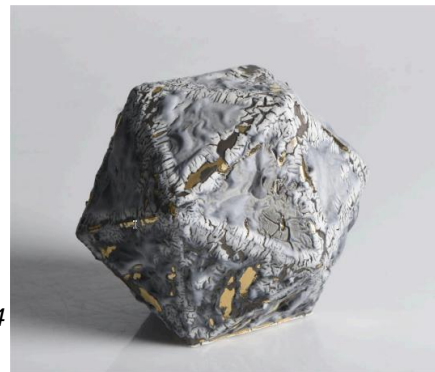
Mary Conroy - Open Cut - 2024

Beeld, afwerking en manier van presenteren, alle drie deze componenten zeggen iets over wat hoe de toeschouwer een beeld interpreteert. In April wil ik hier graag wat dieper op in gaan, met wat voorbeelden en gezamenlijk kijkoefening ga je zelf nadenken over hoe jouw beelden meer kunnen winnen aan zeggingskracht.