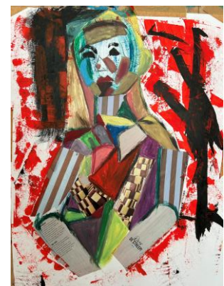
Portret, gemengde techniek door Tisa

15 en 22 april: 1 stand (dus twee lessen hetzelfde model en dezelfde stand)