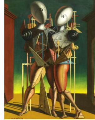
Giorgio De Chirico