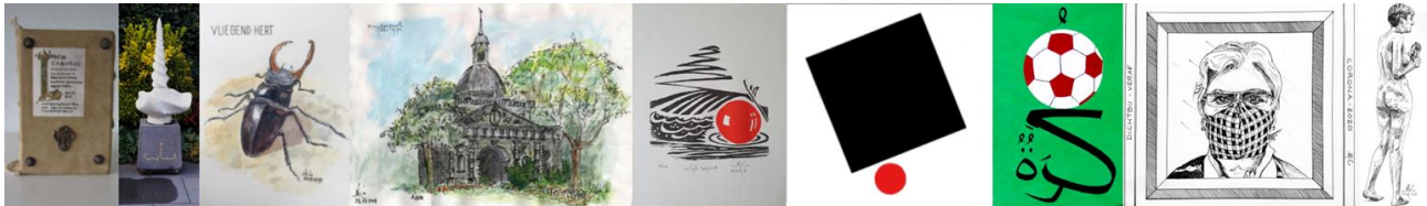
diversiteit van werken