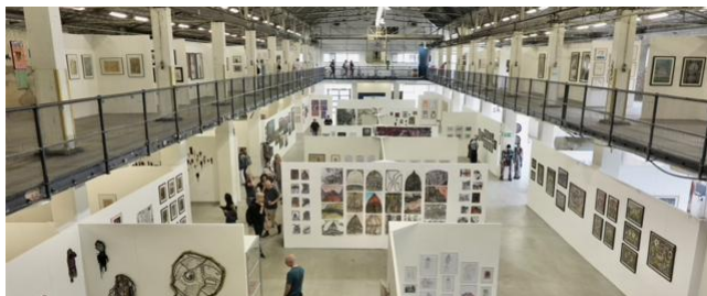
Art brut Biennale Hengelo