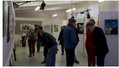
KWA expositie 14 & 15 maart 2026 Het fantastische landschap Hier een kleine impressie van de prachtige werken van onze cursisten.