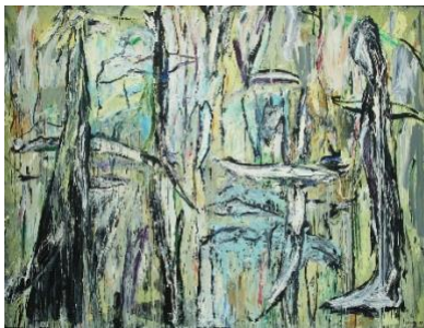
Pieter Stoop, 2005, Zonder titel, olieverf op doek