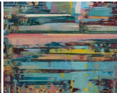
Richard van den Dool, Zonder titel, 2021, olieverf op doek