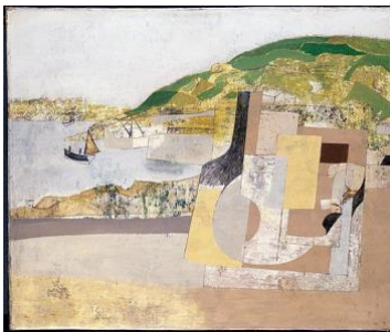
Ben Nicholson, Mousehole, 1947, oil on canvas 46.5 X 58.5 cm