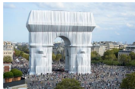
Christo: Arc de Triomphe

Je pakt een aantal voorwerpen in papier, stof, plastic enzovoorts. Denk daarbij aan omwikkelen, plooiën, omvatten, omhullen. Er vormt zich dan een nieuwe huid om het voorwerp, waardoor de functie en het karakter verandert. De vorm kun je daarmee versterken of juist verzwakken, zelfs geheel transformeren. De ingepakte vormen kun je op verschillende manieren belichten en fotograferen: inzoomen op spannende details, als beeldengroep, als landschap of stilleven. Dan kan het daarna nog getekend, geschilderd of beschilderd worden. Neem kleine en/of grote voorwerpen mee en verschillend verpakings- of omhullingsmateriaal. Ook draad, elastiek, touw, tape (gekleurd?), spelden ect.