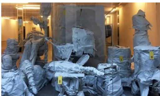
Leerlingen lagere school

De opdracht: Je pakt een aantal voorwerpen in papier, stof, plastic enzovoorts. Denk daarbij aan omwikkelen, plooiën, omvatten, omhullen. Er vormt zich dan een nieuwe huid om het voorwerp, waardoor de functie en het karakter verandert. De vorm kun je daarmee versterken of juist verzwakken, zelfs geheel transformeren. De ingepakte vormen kun je op verschillende manieren belichten en fotograferen: inzoomen op spannende details, als beeldengroep, als landschap of stilleven. Dan kan het daarna nog getekend, geschilderd of beschilderd worden. Neem kleine en/of grote voorwerpen mee en verschillend verpakkings- of omhullingsmateriaal. Ook draad, elastiek, touw, tape (gekleurd?), spelden ect.