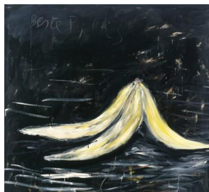
Walter Swennen, Untitled (Beste P., bis), olie & lak op canvas, 190x200 cm. 1984.