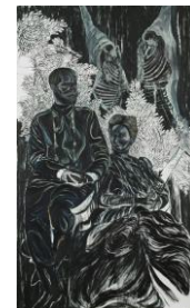
Natasja Kensmil Nicolaas II en Alexandra, olieverf op linnen, 260 x 140 cm. 2008.