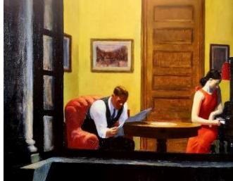
"Room in New York" 1932 Edward Hopper