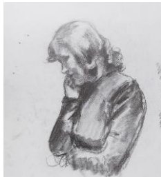
Tekening Edward Hopper

Materiaal: gekleurd (of geveerd) papier, lijm, schaar, (kleur-)potlood, inkt, ecoline, (olie-)pastel, verf.