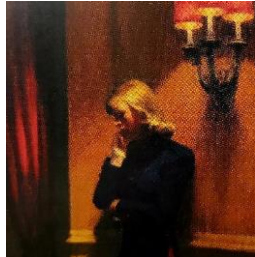
"New York Movie" 1939 Edward Hopper