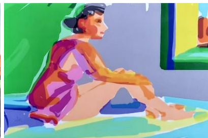
Digitale tekening n.a.v "Morning sun" 1952, Edward Hopper